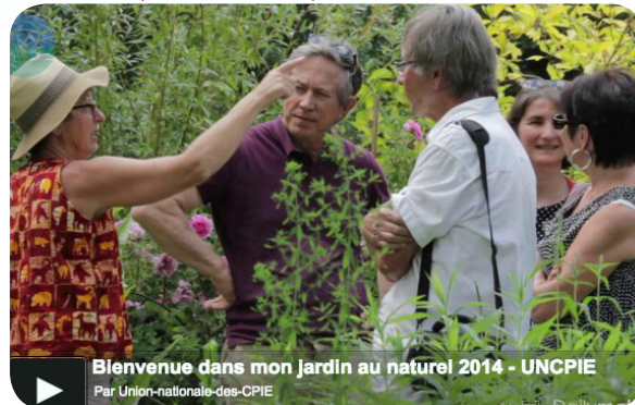
Bienvenue dans mon jardin au naturel 2014 - UNCPIE

la vidéo de présentation de l'opération : http://mon-jardin-naturel.cpie.fr/Content2.aspx?ID=363&Title=Bilan+de+l